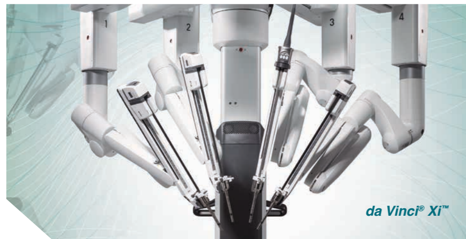
da Vinci® Xi™

Le 30 octobre 2014, le système chirurgical robotisé dernière génération da Vinci® Xi™ , rejoindra le bloc opératoire de l'Infirmérie Protestante. Développée depuis plus de 15 ans aux États-Unis et dans certains pays d'Europe, la chirurgie assistée par robotique s'impose désormais en France pour certaines interventions chirurgicales délicates.